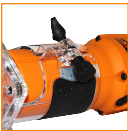
Регулювання глибини фрезерування 0-40 мм