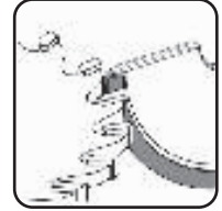
Заточка фрезы по передней поверхности