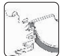
Заточка фрезы по передней поверхности