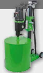
PowerLine PLE 450 B 3300 Вт, 180/400/780 об/хв. Ø 71-450 мм