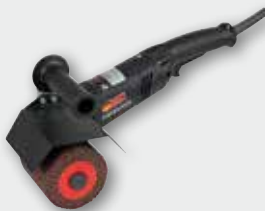
ESM 1310 1300 Вт 1300-3050 об/хв.