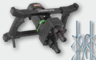
EZR 22 R R/L Set 1300 Вт, 140-400 об/хв. Ø 220 мм, ємність до 60 кг