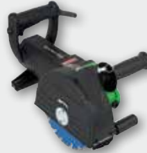
EMF 180 2300 Вт, 2200 об/хв., Ø 180 мм глибина 60 мм, ширина пазу 46 мм