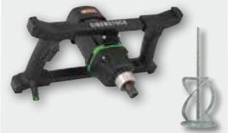
EHR 20.1 R Set 1300 Вт, 250-580 об/хв. Ø 140 мм, ємність до 50 кг