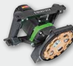
EBS 180 H 2500 Вт, 6000 об/хв. Ø 180 мм