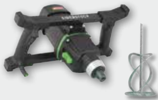
EHR 23/2.4 S Set 1800 Вт, 0-250/0-580 об/хв. Ø 180 мм, ємність до 80 кг