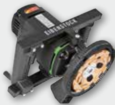
EBS 1802 1800 Вт, 10000 об/хв. Ø 125 мм