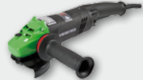
EZW 125 1400 Вт, 10000 об/хв. Ø 125 мм