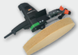
EPG 400 WP 500 Вт, 0-60 об/хв. Ø 370 мм