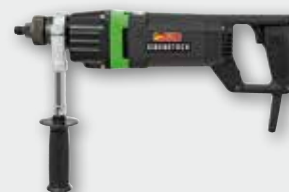
ESD 1801 1800 Вт, 0-2050 об/хв. Ø макс. 90 мм