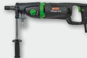
ETN 162/3 2200 Вт, 0-510/-1150/-2500 об/хв. Ø 12-162 (202) мм