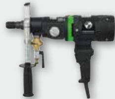
ETN 130/3 P 1800 Вт, 600/1300/2800 об/хв. Ø 12-152 (202) мм