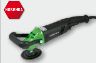
EPO 1401 1400 Вт 700-3300 об/хв.