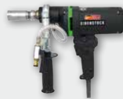
END 1550 P 1500 Вт, 1800-4400 об/хв. Ø 6-68 мм (оптимальне 50 мм)

Вироблено в Німеччині сертифіковано DIN EN ISO 9001:2008