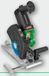
EDS 181 2300 Вт, 4300 об/хв., Ø 200 мм макс. глибина різку 63 мм