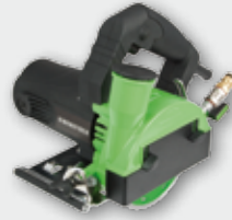
EDS 125 1250 Вт, 12500 об/хв., Ø 125 мм макс. глибина різку 36 мм