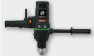
EHB 32/2.2 R R/L 1800 Вт, 60-140/200-470 об/хв. Ø 32 мм в металі