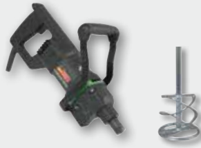
EHR 15.1 SB Set 1050 Вт, 0-450 об/хв. Ø 120 мм, ємність до 40 кг