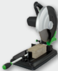
EST 350.1 2400 Вт, 3900 об/хв., Ø 350 мм макс. глибина різку 120 мм