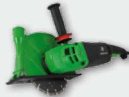
ETR 230 2600 Вт, 6500 об/хв., Ø 230 мм макс. глибина різку 65 мм