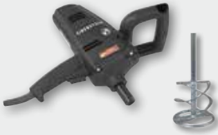
EHR 14.1 SK Set 960 Вт, 0-390 об/хв. Ø 120 мм, ємність до 30 кг