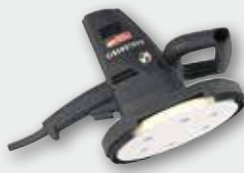
ETS 225 700 Вт, 0-1450 об/хв. Ø 225 мм