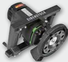
EBS 1802 SH 1800 Вт, 10000 об/хв. Ø 125 мм