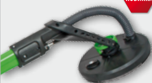
ELS 225 750 Вт, 1050-1600 об/хв. Ø 225 мм