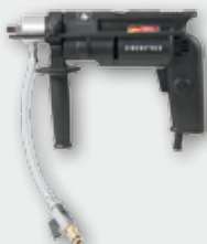
END 712 P 700 Вт, 0-8000 об/хв. Ø 3,5-12 (18) мм