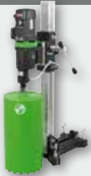
DBE 250 R 2500 Вт, 360/850 об/хв. Ø 52-250 мм