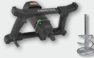
EHR 18 S Set 1100 Вт, 0-450 об/хв. Ø 120 мм, ємність до 40 кг