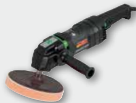
WPO 180 1200 Вт 1500-2800 об/хв.