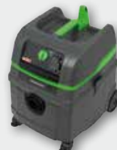
DSS 25 A/DSS 50 A макс. 1400 Вт, автоматична чистка фільтра, об'єм бака 25/50 л