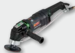
WPN 180 1200 Вт 1500-2800 об/хв.