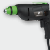
ESR 450 450 Вт, 0-4000 об/хв. Ø 5 мм, 1,2 кг