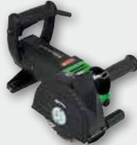
EMF 150 2300 Вт, 4300 об/хв., Ø 150 мм глибина 45 мм, ширина пазу 46 мм