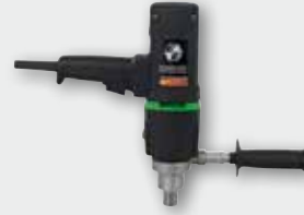
EHB 20/2.4 1150 Вт, 250/450 об/хв. Ø 20 мм в металі