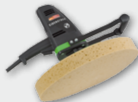
EPG 400 500 Вт, 0-60 об/хв. Ø 370 мм