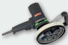
EPF 1503 1500 Вт, 4000 об/хв. Ø 140 мм