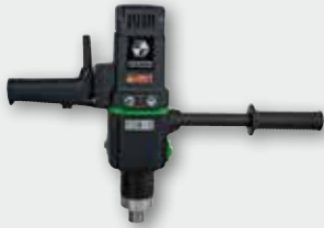
EHB 32/4.2 1700 Вт, 110/175/245/385 об/хв. Ø 32 мм в металі