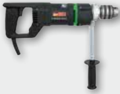
EHB 16/1.4 S R/L 1150 Вт, 0-450 об/хв. Ø 20 мм в металі