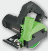
EDS 125 T 1250 Вт, 12500 об/хв., Ø 125 мм макс. глибина різку 36 мм