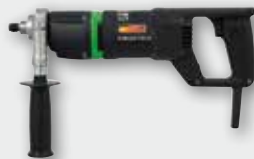
EHD 1300 1300 Вт, 0-2000 об/хв. Ø 32-82 мм