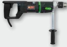
EHB 16/2.4 S R/L 1100 Вт, 0-430/0-760 об/хв. Ø 16 мм в металі