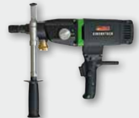
PowerLine PLD 160 2300 Вт, 600/1400/3000 об/хв. Ø 12-162 (202) мм