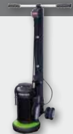
EBS 235.1 2200 Вт, 1380 об/хв. Ø 235 мм