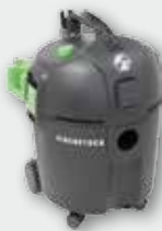
SS 1400 макс. 1400 Вт, кнопка чистки фільтра, об'єм бака 25 л