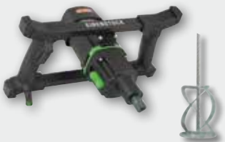
EHR 20/2.5 S Set 1300 Вт, 0-250/0-450 об/хв. Ø 140 мм, ємність до 50 кг