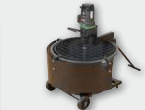
Automix 1801 1500 Вт, 50 об/хв. 65 л, ємність до 50 кг