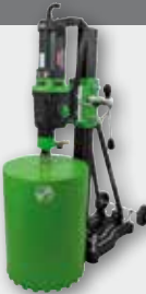
DBE 352 3000 Вт, 230/500/1030 об/хв. Ø 42-352 мм