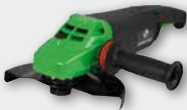
EZW 230 2600 Вт, 6500 об/хв. Ø 230 мм