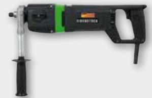
EHD 2000 S 1700 Вт, 0-1000/0-2000 об/хв. Ø 32-132 мм