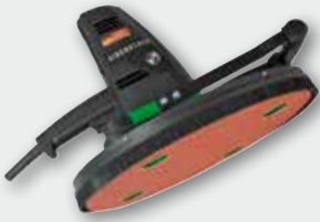
EWS 400 800 Вт, 0-85 об/хв. Ø 370 мм