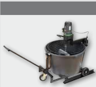
Automix 90 1500 Вт, 50 об/хв. 90 л, ємність до 80 кг