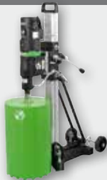
DBE 300 2800 Вт, 270/700/1250 об/хв. Ø 25-300 мм