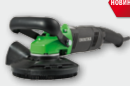
EBS 120 1400 Вт, 10000 об/хв. Ø 125 мм