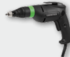
ESR 500 500 Вт, 0-4650 об/хв. Ø 5 мм, 1,1 кг